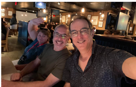
LE FER DE LANCE