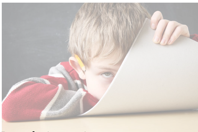
La profession enseignante

Évidemment, le Syndicat de l'enseignement de la région de Laval (SERL) s'oppose vigoureusement à cette décision et fera toutes les représentations nécessaires pour tenter de faire reculer la commission scolaire.